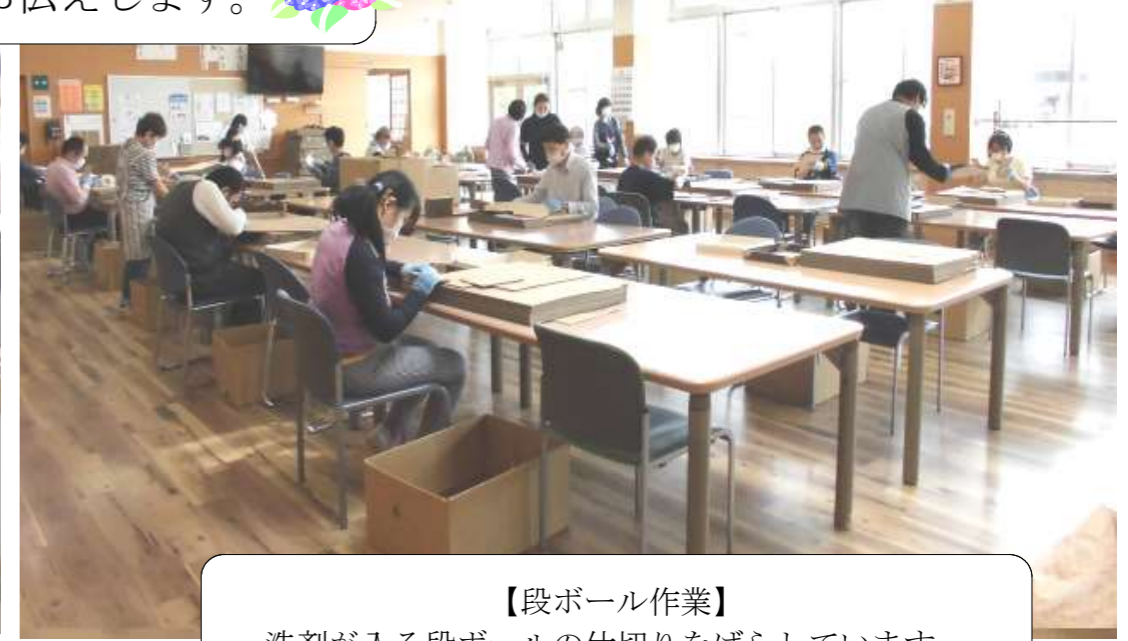
【段ボール作業】 洗剤が入る段ボールの仕切りをばらしています。